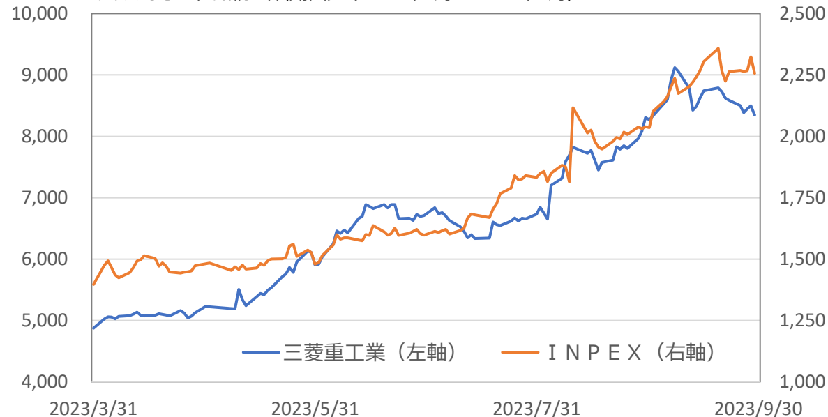
◆プラス寄与上位銘柄の株価推移（2023年4月～2023年9月）