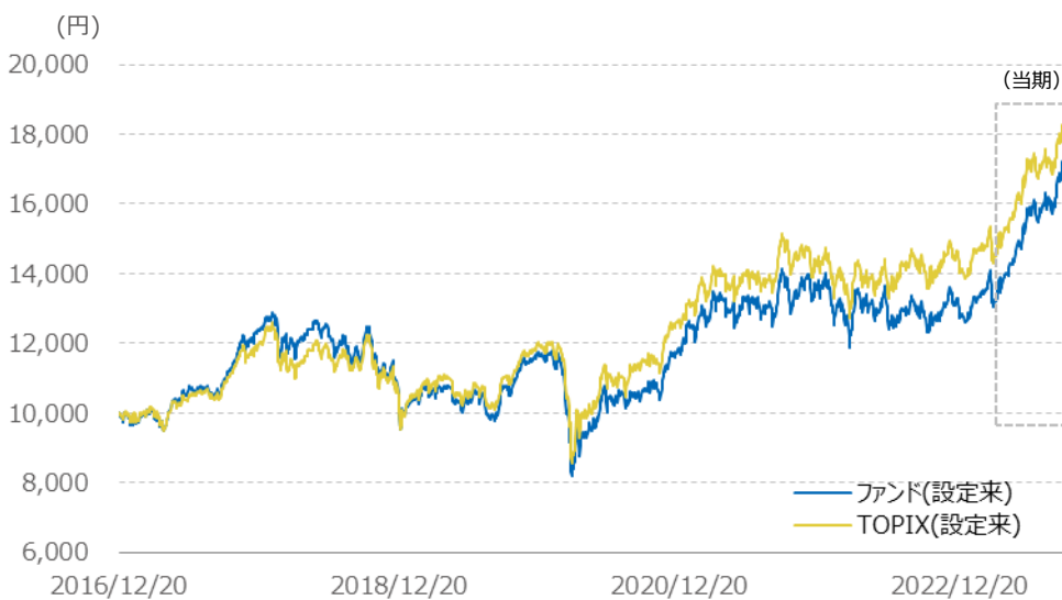
基準価額の推移／当期 (2023年4月～2023年9月末)